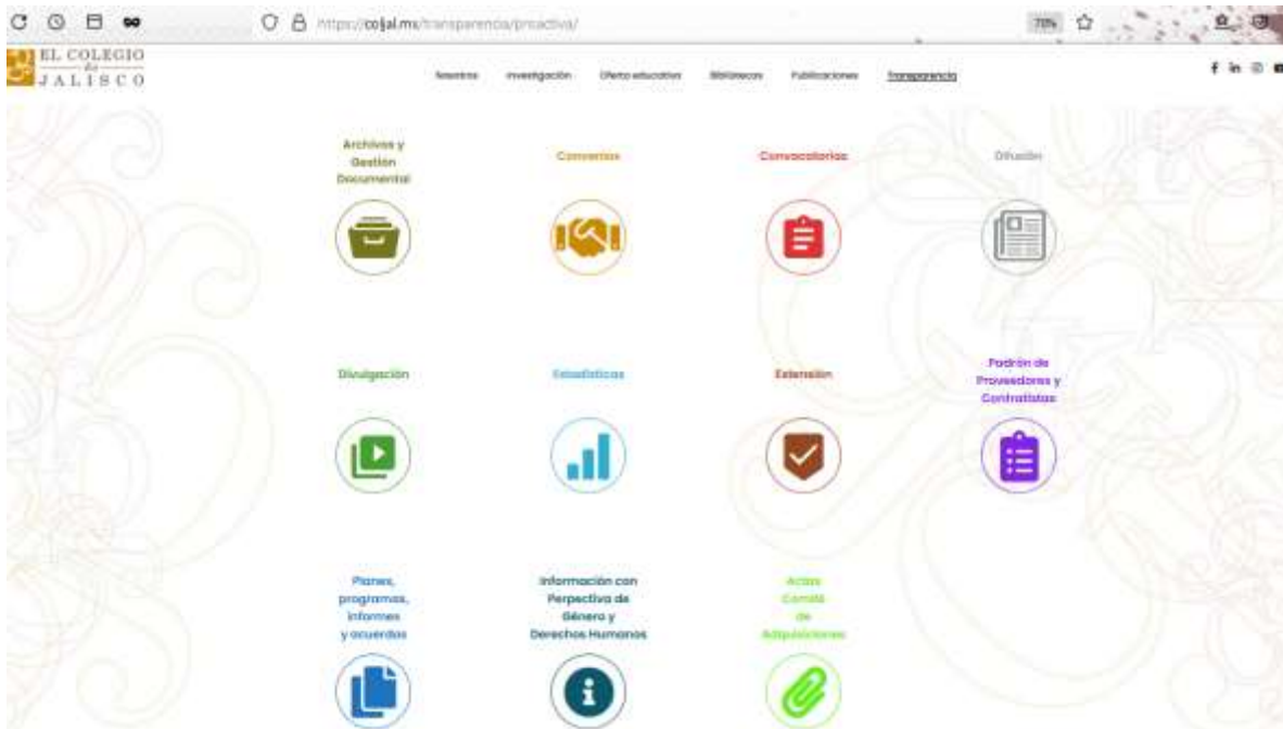
Imagen 5. Portal de transparencia proactiva.