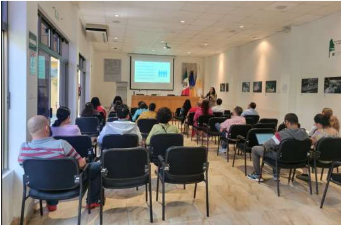
Imagen 3: Segunda sesión del curso de capacitación: "Herramientas para la ética y la prevención de la corrupción". 17 de octubre 2024.