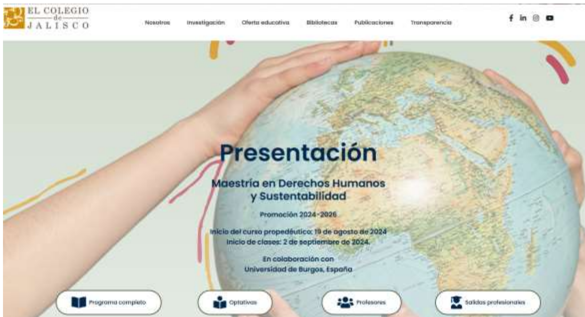
Imagen 6. Presentación MDHS en página de El Colegio de Jalisco

Para la primera generación se aceptaron 14 alumnos en este programa, con modalidad asincrónica y cuyas clases iniciaron el 02 de septiembre de 2024. La información relacionada con la MDHS se encuentra en el siguiente enlace: https://coljal.mx/oferta-educativa/maestria-en-derechos-humanos/