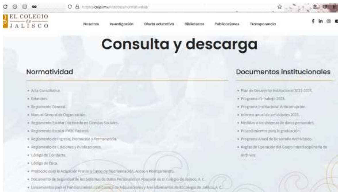
Imagen 1. Normatividad de El Colegio de Jalisco