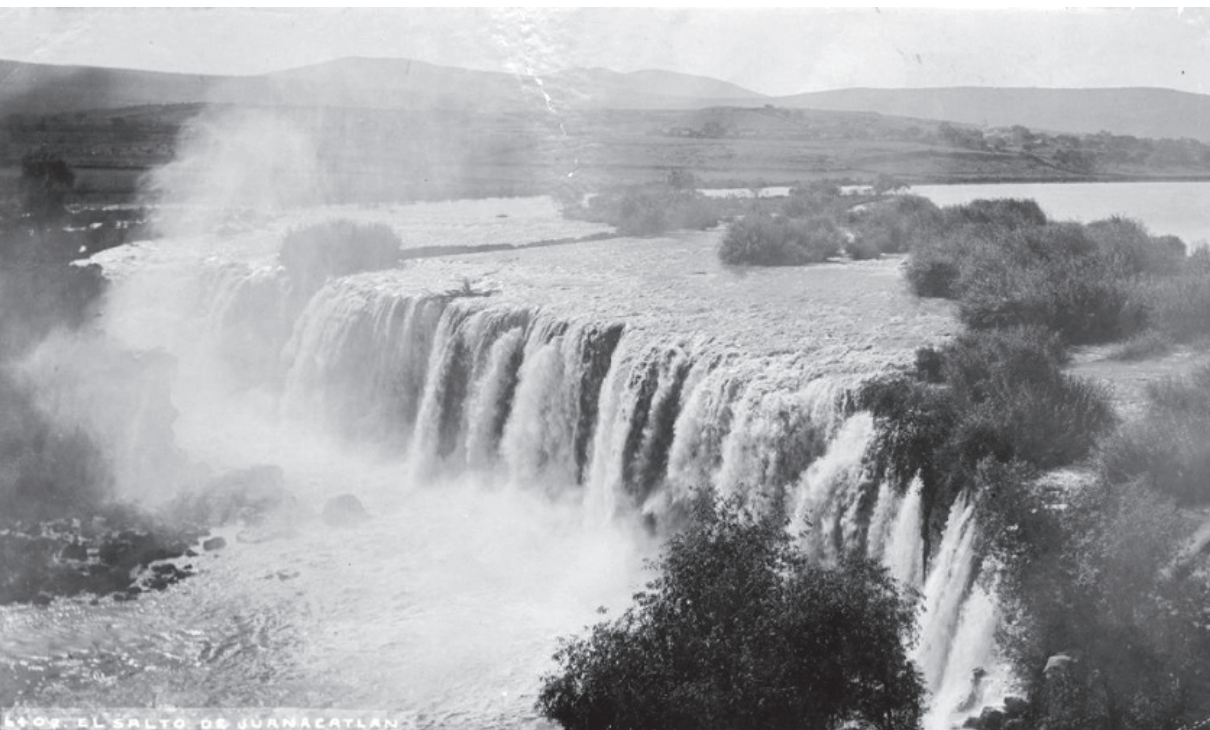
Vista panorámica de El Salto de Juanacatlán, 1905.